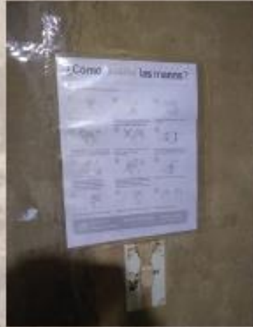
Imagen 12. Manual de lavado de manos.