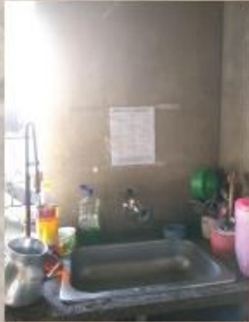
Imagen 11. Manual de lavado de manos en la cocina.