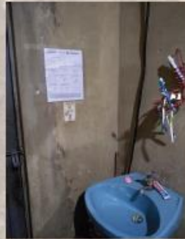
Imagen 13. Manual de lavado de manos en el baño.